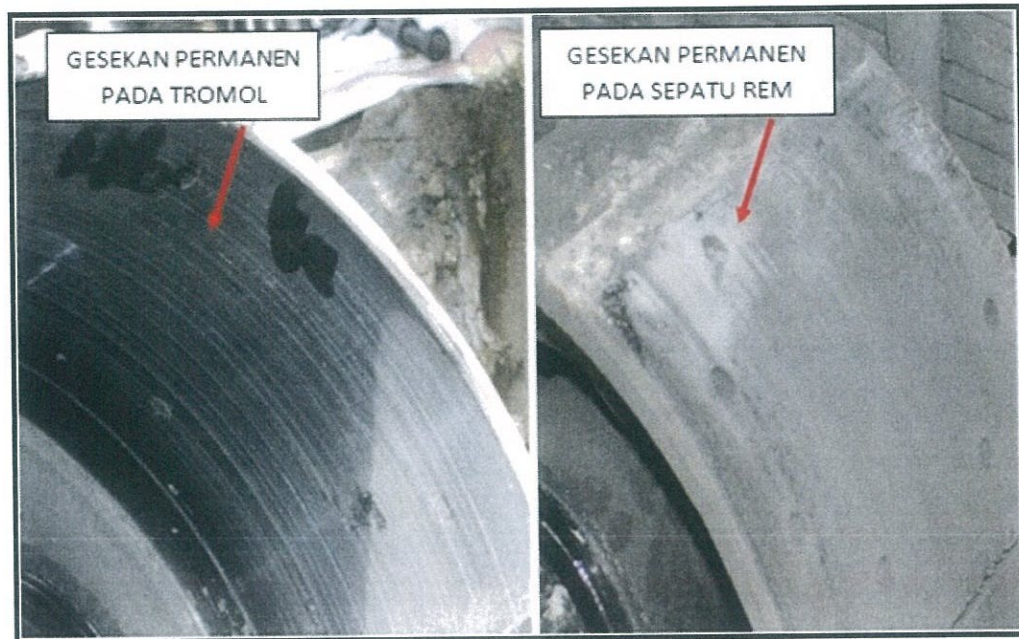
Gambar 2. Kondisi sistem rem roda belakang sebelah kanan yang bermasalah