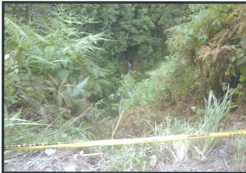
Gambar 1. Lokasi jatuhnya kendaraan