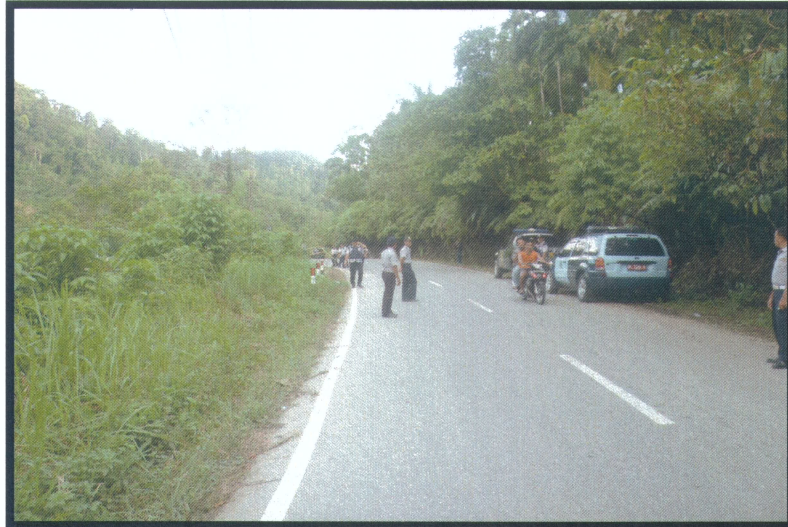
Gambar 2. Jalan disekitar lokasi kejadian