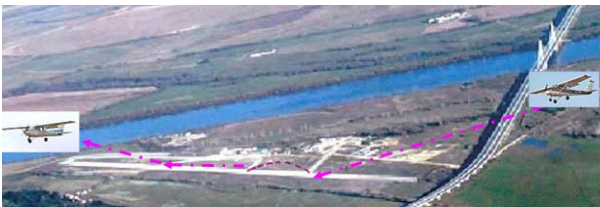
Figura Nº 1

Remeteu motor, seleccionou ar frio para o carburador e recolheu os flaps gradualmente, nas velocidades ( figura nº 1 ).