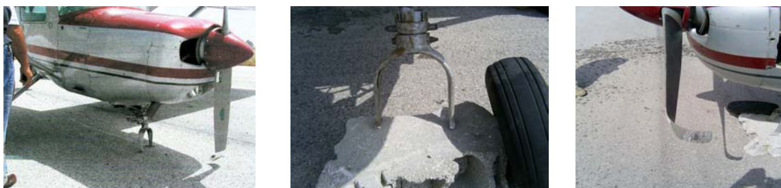
Figura Nº 3

A aeronave sofreu danos ligeiros no hélice a fractura do trem de aterragem de proa, conforme imagens na figura nº 3. Por se encontrar a rodar a baixas rotações, o motor não sofreu danos significativos.