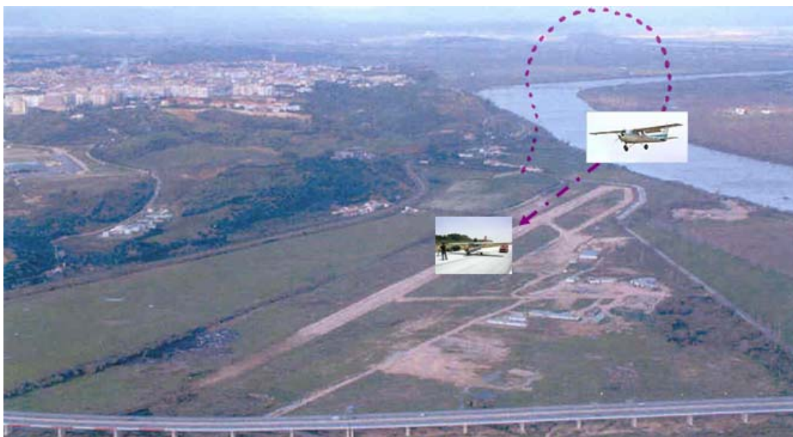
Figura Nº 2

Aterrou no segundo terço da pista e rolou alguns metros até o hélice colidir com o asfalto e danificar as pontas, ficando a aeronave imobilizada cerca de 20 metros antes da intercepção do taxiway ( figura nº 2 ).