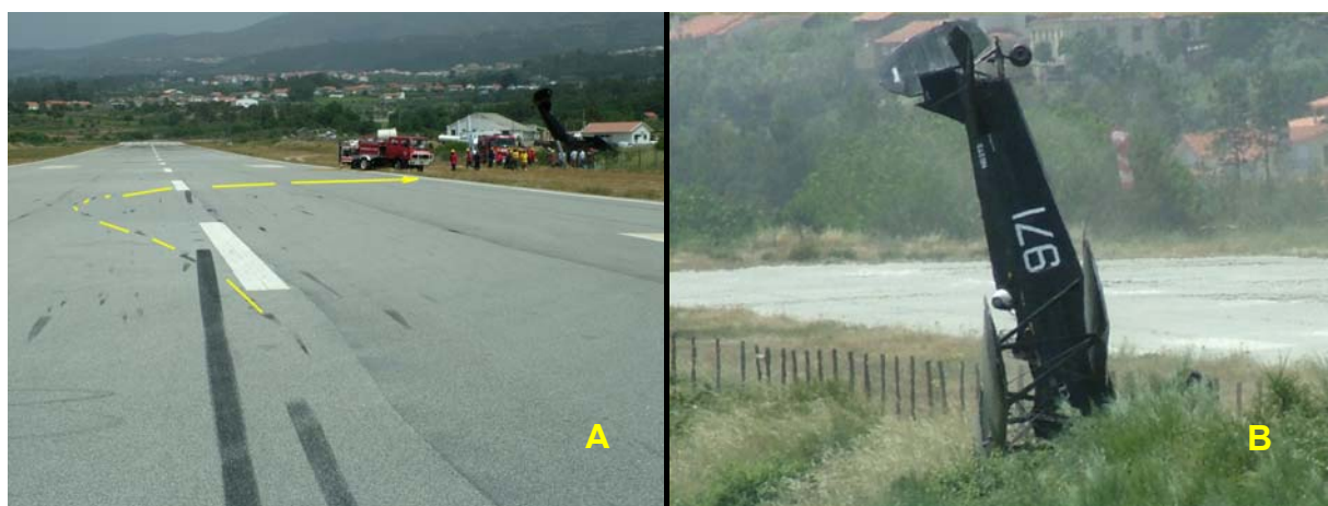
Figura Nº 1

Aterrou cerca das 13:00 horas, na pista 08, tocando inicialmente com as rodas do trem principal e mantendo a cauda no ar. Sentindo que o avião se desviava para o lado esquerdo da pista, o piloto corrigiu esta tendência com pé direito e acelerando momentaneamente o motor. O avião iniciou então uma volta apertada para a direita, levantou a roda direita do chão e tocou com a ponta da asa esquerda inferior na pista, acabando por sair desgovernado pela berma direita, derrubando a vedação de arame e indo imobilizar-se no terreno adjacente, com a asa direita e o motor assentes no solo e a cauda no ar ( figura nº 1 ).