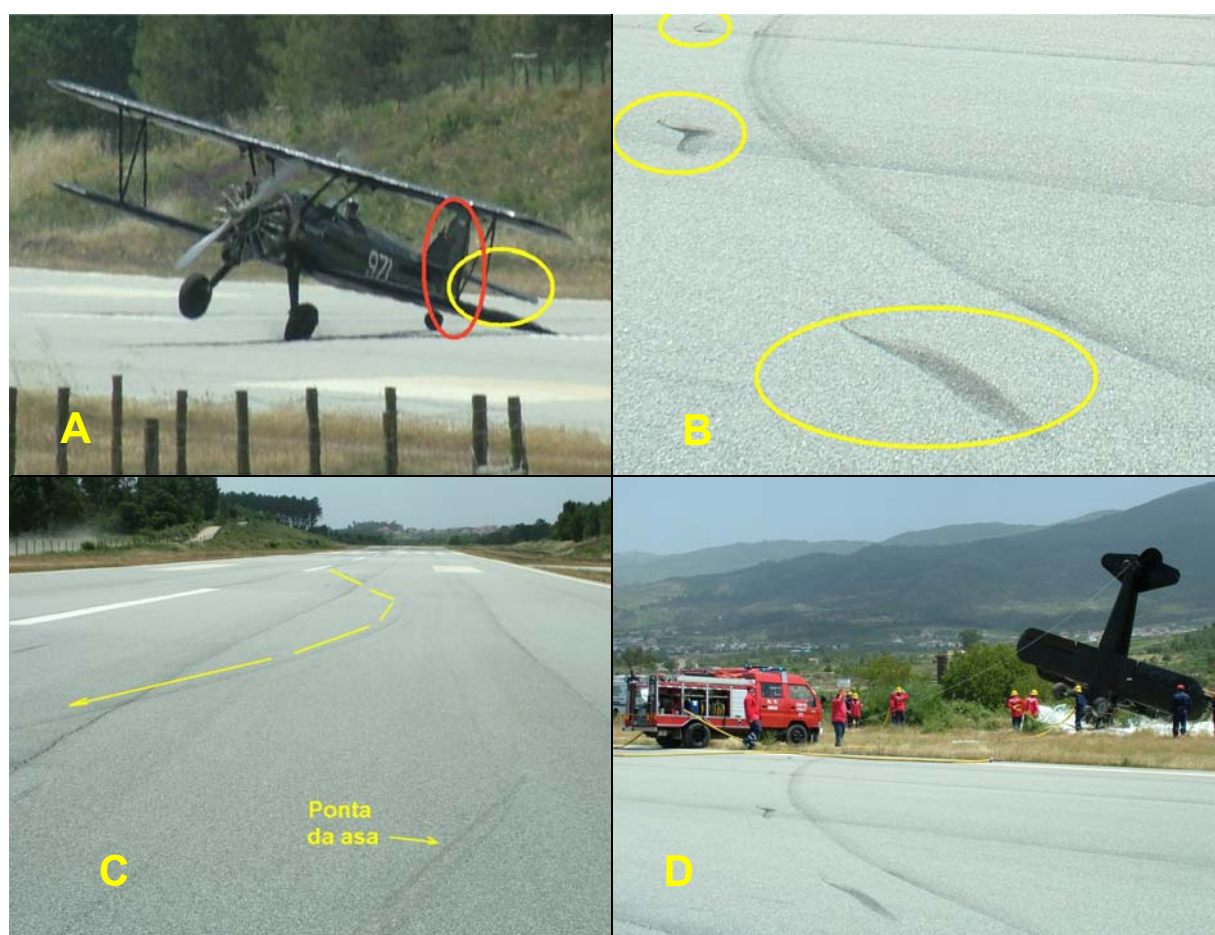
Figura Nº 3

O facto de o piloto ter mantido o leme de direcção na deflexão máxima para a direita ( figura nº 3-A ), a configuração do trem de aterragem (convencional) e a roda de cauda não se encontrar devidamente apoiada na pista ( figura nº 3-B ), potenciaram a volta da aeronave para a direita, a qual não capotou porque a asa esquerda, ao tocar na pista, o evitou ( figura 3-A e C ).