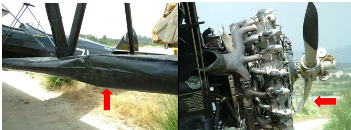
Figura Nº 2

A aeronave sofreu danos ligeiros no bordo de ataque da asa esquerda e numa pá do hélice.