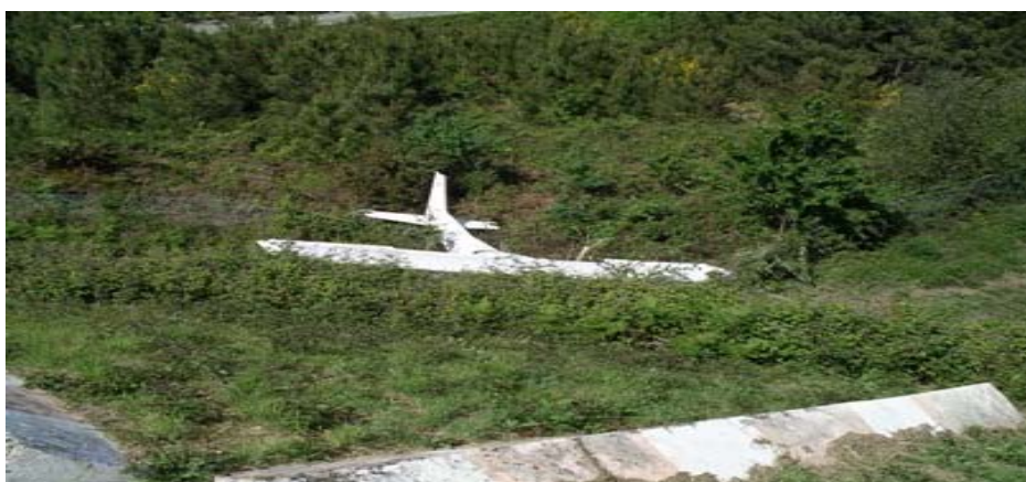
Marca de pista

O acidente deu-se num terreno coberto de vegetação rasteira (silvas e pequenos arbustos) e com algumas árvores de médio porte. O local fica situado no limite norte do aeródromo de Vila Real, junto à cabeceira da pista 20 (N 41° 16, 55' W 007° 43, 20').