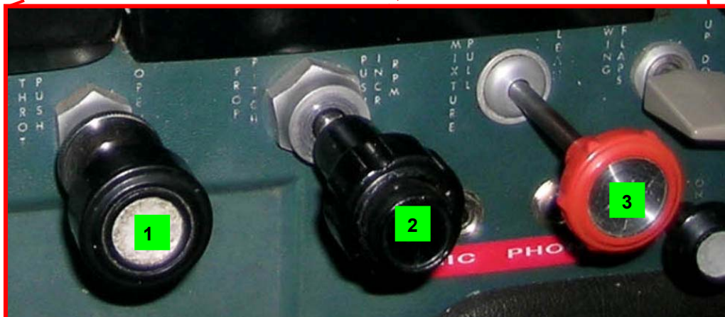
Fig. 8 – Comandos de potência, passo do hélice e mistura.