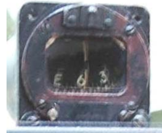
Fig. 6 – Bússola indicando 058°

1.12.1 Local – O impacto da aeronave verificou-se num terreno de grande inclinação, densamente arborizado por eucaliptos, e imobilizou-se com a proa apontada a 058°, a aproximadamente, 17,00 m da estrada N 519, 60,00 m do parque Norte e 350,00 metros do Santuário do Sameiro, erguido na cota 572 m (1 877 pés) do Monte do Sameiro, o mais alto da região de Braga.