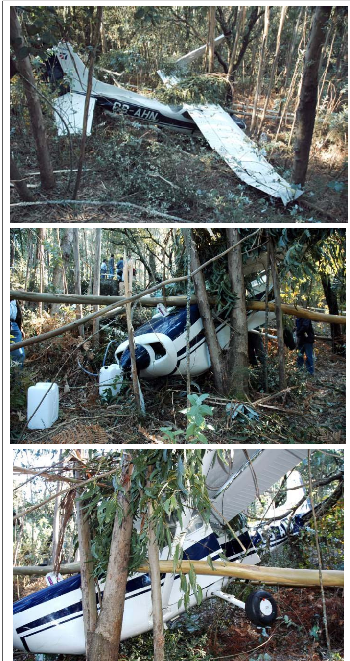
Figs. 2, 3 e 4 – Posição final da aeronave.

008° 22' 24" W, num local denominado por Lugar das Lages Negras – Nogueiró.