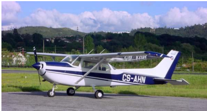
Fig. 5 – O Cessna FR 172H Reims, CS-AHN, antes do acidente

O CS-AHN era uma aeronave terrestre monomotor, de asa alta e trem fixo triciclo, da marca Reims/Cessna, modelo FR 172H Rocket de quatro lugares, fabricado, sob licença da Cessna Aircraft Company, pelo construtor Francês Reims Aviation. A sua massa máxima à descolagem era de 1 157 kg.