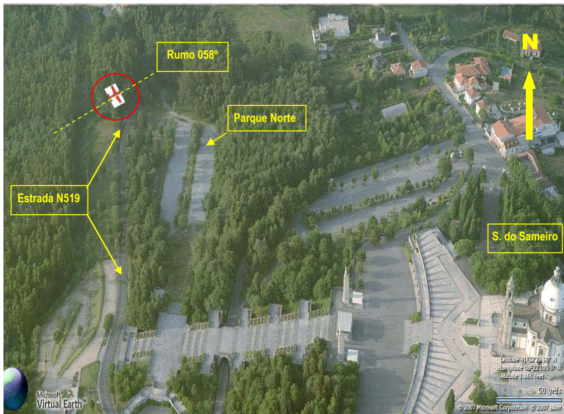
Fig. 7 – Posição relativa do CS-AHN

Outras altitudes: Imobilização da aeronave – cota 520 m (1 706 pés). Ponto mais alto do Santuário (zimbório) – 2 044 pés. Altitude média da escadaria – 1 780 pés.