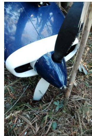
Fig. 9 – Hélice em passo grosso

O exame feito ao hélice, no local do acidente, mostrou as pás na posição de “passo grosso”, acusando concordância com a posição do respectivo comando no painel de instrumentos.