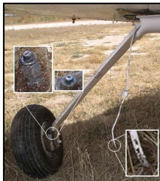
Figura Nº 5