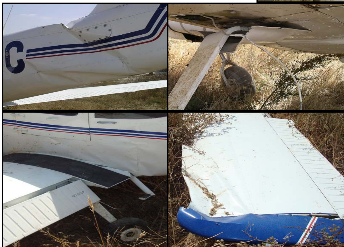
Figura Nº 2