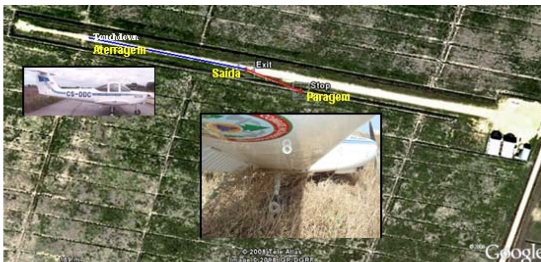
Figura Nº 1

O avião manteve-se na zona central da pista durante cerca de 200m, altura em que começou a desviar-se lentamente para a direita. O piloto tentou segurar o avião no centro da pista, usando o leme de direcção e travagem diferencial da roda esquerda, mas sem sucesso. A aeronave continuou a desviar-se, saiu da zona limpa da pista e entrou na berma, coberta de arbustos altos e secos, só vindo a parar cerca de 80m depois ( figura nº 1 ), quando o trem entrou numa vala e o hélice e nariz do avião colidiram com a cerca que faz a vedação do campo.