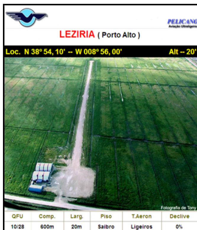
Figura Nº 3