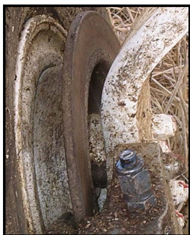
Figura Nº 6