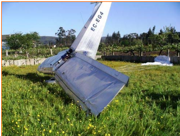
Figura nº 2 – posição final da aeronave.

A aeronave “pousou” no quintal de uma vivenda, num local onde havia, nas proximidades, árvores de elevado porte, linhas de alta tensão e vinhas aramadas.