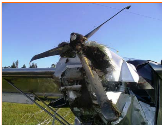
Figura nº 4 – grupo moto propulsor.

A roda do trem esquerdo estava em falta.