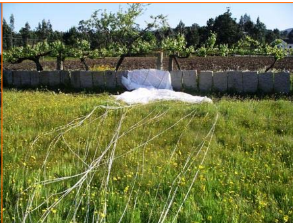
Figura nº 3 – pormenor do pára-quedas.