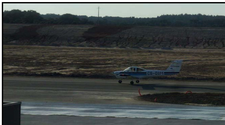
Figura Nº 3

Tendo efectuado diversas chamadas rádio na frequência atribuída ao aeródromo de Ponte de Sor, sem obter resposta, chegado à vertical pelas 16:45, o piloto efectuou uma volta sobre a pista para verificar a direcção do vento e qual o sentido de aterragem. Perante as marcas existentes na pista, mas sem ter conhecimento de nenhum NOTAM de encerramento, o Piloto Instrutor (PI) decidiu efectuar uma passagem baixa para confirmar da existência de qualquer obstáculo e, considerando que a pista se encontrava desobstruída, resolveu prosseguir com o objectivo do voo, efectuando um simulacro de falha de motor e aterragem de emergência e aterrando entre a marca do início da pista 20 e a marca colocada a meio da mesma ( figura nº 3 ), “ demonstrando ao Aluno Piloto (AP) que é possível aterrar numa pequena faixa de terreno, se seguidos os diversos procedimentos operacionais e de segurança ” (sic).