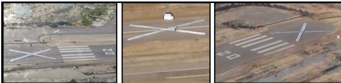
Figura Nº 1

Na data fixada para o início do encerramento foram colocadas marcas de sinalização visual ( figura nº 1 ), conforme recomendado pelo § 7.1 do Anexo 14 à Convenção sobre a Organização Internacional da Aviação Civil (ICAO), Chicago 1944.