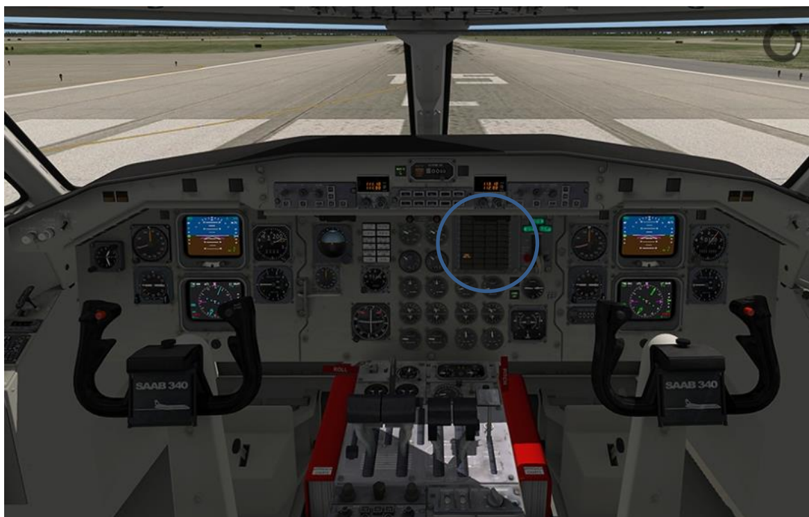
Esquema de la cabina de vuelo, donde se detalla la ubicación del panel central de alarmas.

El panel central de alarma de cabina de vuelo (CWP) está compuesto por un total de cuarenta (40) anunciadores lumínicos. Cada uno de los indicadores cuenta con dos micro lámparas incandescentes que se encienden simultáneamente para dar el anuncio. Con los restos que pudieron recuperarse de ese conjunto, se procedió a la remisión en las instalaciones del fabricante (bajo supervisión de la SHK Sueca), con el objetivo de determinar si alguna de las alarmas se encontraba activada al momento del accidente.