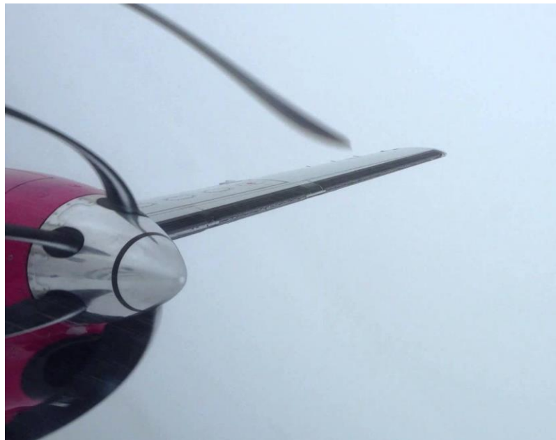
Ejemplo de ubicación de botas desheladoras de borde de ataque, en una aeronave similar.

Esas botas neumáticas protegen los bordes de ataque de las alas (tanto interno como externo) y los bordes de ataque del estabilizador vertical y el horizontal.