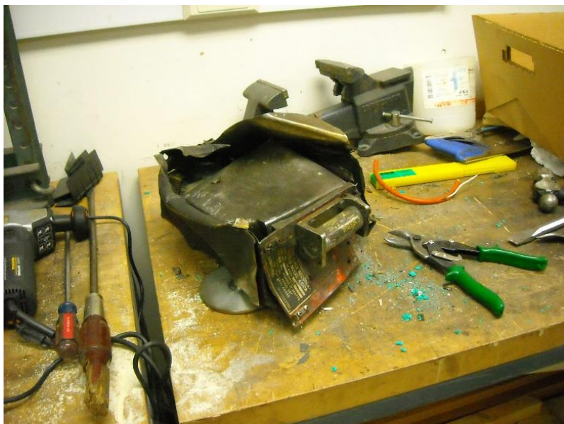
Estado del equipo CVR al momento del desarme.

1.11.4.1.2 Mediante la utilización de herramientas manuales se extrajo la estructura protegida, con el medio de registro, apartando y preservando el resto del equipo. Al retirar el subconjunto y proceder a su apertura, se observó que la protección térmica interna había sido afectada por el incendio. En la extracción de la última cubierta de protección mecánica se observaron fracturas y daños que llegaban hasta el propio medio de registro, cabezales de grabación y demás componentes internos.