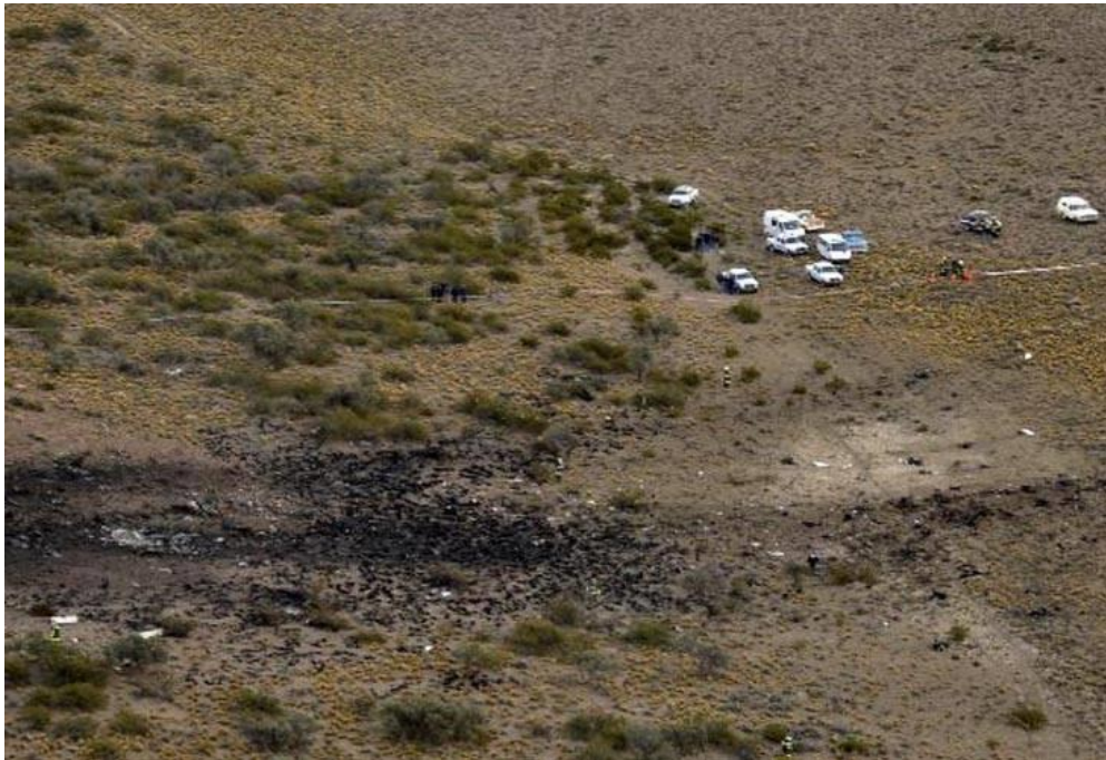
Vista aérea de la zona del impacto.