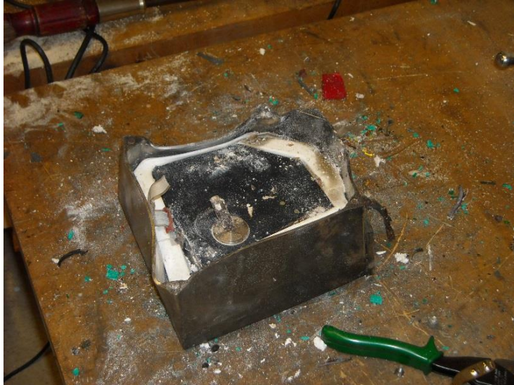
Estado del equipo FDR al momento del desarme.

1.11.5.1.3 Se extrajeron ambos carretes donde la cinta sinfín se desplazaba y se procedió a una cuidadosa limpieza, para luego realizar la reconstrucción de los sectores dañados. Se utilizaron técnicas manuales de empalme, mediante el empleo de adhesivos específicos y cinta “líder” de refuerzo.